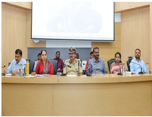
సైబరాబాద్ కమిషనరేట్, క్రైమ్ బ్యూరో జూలై 03 (పీపుల్స్ న్యూస్) : సైబరాబాద్ సీపీ కార్యాలయం, ఆడిటోరియంలో శుక్రవారం ఆపరేషన్ ముస్కాన్-12 సమన్వయ సమావేశాన్ని నిర్వహించారు. ఈ సమావేశంలో సైబరాబాద్ పోలీస్ కమిషనర్ డా. ఎం. రమేష్ పాల్గొని తప్పిపోయిన పిల్లలను గుర్తించడం, భిక్షాటన, పాత వస్తువులు ఏరుకోవడం, బాల కార్యకర్తల/బాల