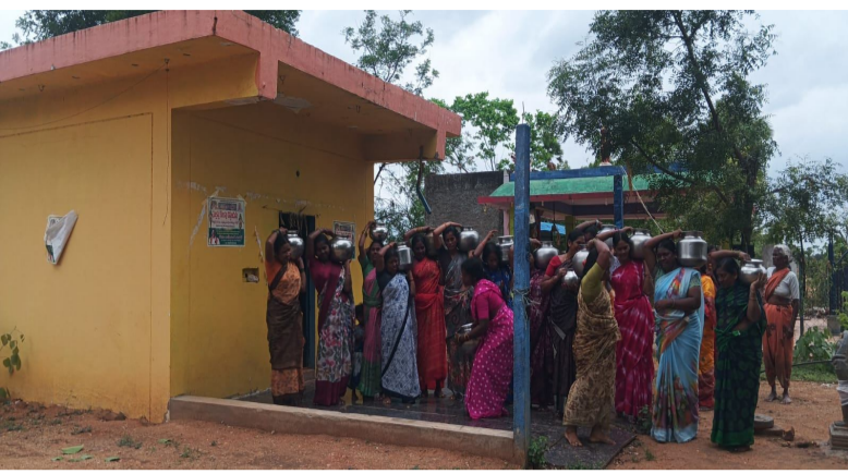
చిటూల ప్రతినిధి జూలై 3 (వీపుల్స్ న్యూస్) ఈ వానకాలంలో వానలను దండిగా కురిపించాలని వేడుకుంటూ చిటూల మండల కేంద్రం లోని చింతలపల్లి గ్రామంలో శుక్రవారం మహిళలంతా పోచమ్మ తల్లి దేవతకి పెద్దమ్మ తల్లి దేవతకి జలాభిషేకం చేశారు. నెల రోజులు కాలం