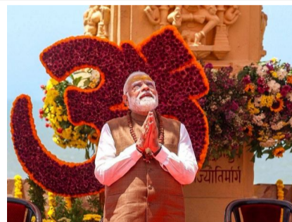
న్యూఢిల్లీ, జూలై 3 : అమర్ నాథ్ యాత్రను పురస్కరించుకుని ప్రధాని సరేంద్ర మోడీ