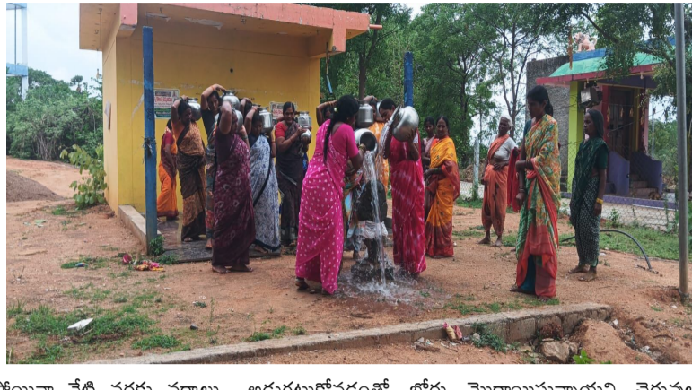
పోయినా నేటి వరకు వర్షాలు లేకపోవడంతో పంట చేలలో విత్తనాలు మొలకెత్తలేని దుస్థితి నెలకొందని వారు ఆవేదన వ్యక్తం చేశారు. ఇప్పటివరకు ఒక్కటి కూడా గడ్డి వాన పడకపోవడంతో పాడి నేలలో వేసిన విత్తనాలు మొలకెత్తకుండానే మాడిపోతున్నాయని బోర్ల ద్వారా నీటిని అందించాలని ప్రయత్నం చేసినప్పటికీ భూగర్భ జలాలు