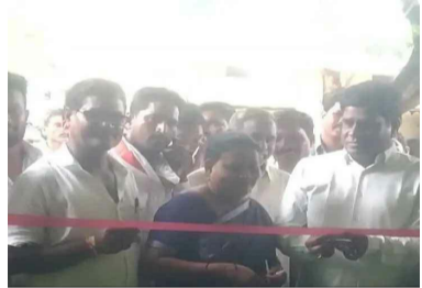
కార్యక్రమంలో కాంగ్రెస్ పార్టీ నాయకులు బాత్ రెవెన్యూ డివిజన్ కార్యకర్తలు పాల్గొన్నారు.

కొమరం బీమ్ ఆసిఫాబాద్ : జూలై 03, : కొమరం బీమ్ ఆసిఫాబాద్ జిల్లా బెజ్జర్ మండల కేంద్రంలో ఎస్.ఐ.ఆర్. 2026 ప్రతి ఓటరుకు అవగాహన కల్పించే లక్ష్యంతో ఏర్పాటు చేసిన సహాయ కేంద్రాన్ని ఉమ్మడి ఆదిలాబాద్ జిల్లా ఎమ్మెల్యే కుమార్తె ప్రారంభించారు. ఈ కార్యక్రమంలో బిఎల్ఎ, పాల్గొని, ఓటరు నమోదు, సవరణలు, ఓటరు జాబితా సంబంధిత అంశాలపై ఉమ్మడి ఆదిలాబాద్ జిల్లా ఎమ్మెల్యే దండే విరళ అవగాహన కల్పించారు. ఈ