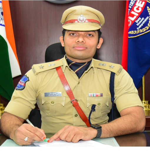
హైదరాబాద్, క్రైమ్ బ్యూరో జూన్ 24 (పీపుల్స్ న్యూస్):