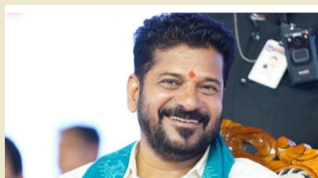
హైదరాబాద్, జూన్ 24 :

ఒకేసారి ఐదు కేసుల కొట్టివేత 2019 నాటి కేసుల నుంచి రేవంత్ రెడ్డికి విముక్తి ఎన్నికల కోడ్ ఉల్లంఘన కేసుల్లో క్లీన్ చిట్