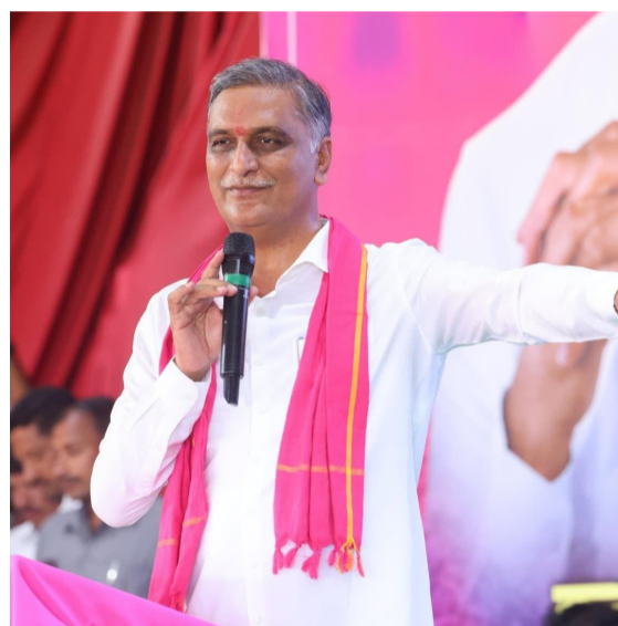
హైదరాబాద్, జూన్ 24 :

కర్ణాటక అక్రమ ప్రాజెక్టులతో పాలమూరు ఎడారి అర్జివన్, తుమ్మిళ్ల, భీమా ప్రాజెక్టుల ప్రయోజనాలు కాపాడాలి నీటి వాటాల కోసమే తెలంగాణ పోరాడి గెలిచింది కర్ణాటక దురాగతాలను అడ్డుకోకుంట్ మళ్లీ పోరాటం తప్పదు సిఎం రేవంత్ కు హానీ రావు బహిరంగ లేఖ