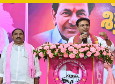
భిమ్మం, జూన్ 24:

రేవంత్ రెడ్డి రెగ్యులర్ సీఎం కాదు కాంగ్రెస్ అధికారంలోకి రావడంతో ఆగమైన రాష్ట్రం జిల్లా ప్రాజెక్టులపై మంత్రుల నిర్లక్ష్యం సత్తుపల్లి పర్యటనలో కేటీఆర్