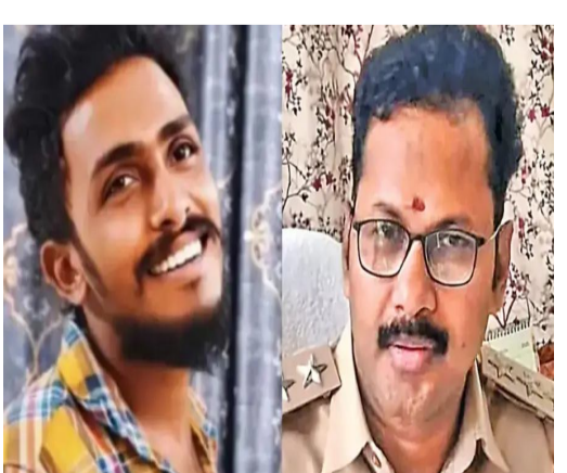
విజయవాడ జూన్ 24 :

సిబ్ నిర్ధారణ.. విజయవాడ కోర్టుకు రిమాండ్ రిపోర్ట్ సమర్పణ సీసీబీఐ ఫుట్జే డిబీఓ, మృతదేహం మాయం చేశారని వెల్లడి కృష్ణా లంక సీబి నాగార్జునకు 14 రోజుల రిమాండ్ దర్యాప్తునకు సీబి సహకరించడం లేదని సిబ్ ఆరోపణ