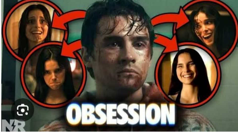
ఈ విజయం అల్పార్థిమల కంటే ఫిలిం మేకర్స్ పై నమ్మకం పెంచడానికి దోహదపడుతుంది అతిస్పష్టమైన భారత్ పేర్కొన్నారు. యువ దర్శకులు మంచి కాంట్రాక్టులు, ట్రియూట్ కంట్లో సాధించుకోవాలని సూచించారు. కాగా, ఈ చిత్రం ప్రపంచవ్యాప్తంగా ఇప్పటికే 334 మిలియన్ డాలర్లకు పైగా వసూలు చేసి ట్రేడ్ వర్గాలను ఆశ్చర్యపరిచింది.

హాల్లీవుడ్ లో ఓ చిన్న హారర్ సినిమా బాక్సాఫీస్ వద్ద పెను సంచలనం సృష్టించింది. 26 ఏళ్ల క్రితం దర్శకత్వం వహించిన 'అబ్జెక్షన్' చిత్రం భారత్ లో ఊహించని విజయాన్ని అందుకుంది. ఈ సినిమా ఇప్పటివరకు మన దేశంలో రూ.79 కోట్లకు పైగా వసూళ్లు సాధించి, 2026లో అతిపెద్ద హాల్లీవుడ్ హిట్ గా నిలిచింది. కేవలం రూ.75 కోట్ల బడ్జెట్ తో తెరకెక్కిన ఈ సినిమా, భారీ అంచనాలతో విడుదలైన 'ప్రాజెక్ట్ హెయిల్ మేరీ' (రూ.75 కోట్లు) వసూళ్లను అధిగమించడం విశేషం. భారత్ లో అత్యధిక వసూళ్లు సాధించిన హాల్లీవుడ్ చిత్రాల జాబితాలో 'అబ్జెక్షన్' ప్రస్తుతం 28వ స్థానంలో ఉంది. మరో కోటి రూపాయలు వసూలు చేస్తే 'అమెజ్జిన్: ఏజ్ ఆఫ్ అల్ట్రాన్' (రూ.80 కోట్లు) రికార్డును కూడా దాటేస్తుంది.