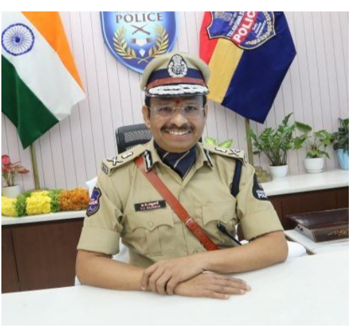
ఎన్ఫోర్స్ మెంట్ విధానాన్ని అవలంబించాలని సమావేశంలో నిర్ణయించారు. దీని ద్వారా నేరం జరగకముందే ముందస్తు