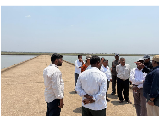
ప్రజలకు సాగు, తాగునీరు అందించడమే లక్ష్యంగా ఎమ్మెల్యే సంజీవరెడ్డి ఈ ప్రాజెక్టుపై ప్రత్యేక క్రడ్ర పెట్టారని, ఆయన సూచనల మేరకే ఈ రోజు అత్యున్నత స్థాయి అధికారులు ఇక్కడికి వచ్చి పరిశీలన జరిపారని అధికారులు తెలిపారు.

నారాయణభట్ రిసెంట్ రిపోర్టర్ పిల్ల శంకరంపేట : నారాయణభట్ ప్రాంత రైతులకు సాగునీరు ప్రజలకు తాగునీరు అందించడమే లక్ష్యంగా నారాయణభట్ ఎమ్మెల్యే డాక్టర్ సంజీవరెడ్డి కృషి మేరకు కీలక అడుగు పడింది ఇందుకు సంబంధించిన వివరాలు ఇలా ఉన్నాయి రాయిపల్లి డ్యాం నిర్మాణ స్థలాన్ని పరిశీలించిన నీటి పారుదల శాఖ ఉన్నతాధికారుల బృందంలో పరిశీలించింది మాన్సూర్ మండలం రాయిపల్లి గ్రామంలో సింగూర్ నీటి నిల్వ కొరకు ప్రతిపాదించిన డ్యాం నిర్మాణ ప్రాజెక్టు వసుల్లో కీలక అడుగు పడింది. గురువారం రాయిపల్లి డ్యాం నిర్మాణ పనులను పరిశీలించిన ఇంజనీరింగ్ సిబ్బంద్ ఎమ్మెల్యే ప్రతిపాదించిన ప్రతిపాదనను ప్రభుత్వం ఆదేశాలు మేరకు ఇంజనీరింగ్ సిబ్బంది డ్యాం నిర్మాణ స్థలాన్ని పరిశీలించడానికి వచ్చినట్లు అధికారులు పేర్కొన్నారు పేర్కొన్నారు ఈ సందర్భంగా నీటిపారుదల శాఖ ఉన్నతాధికారులు ప్రాజెక్టుకు సంబంధించిన సాంకేతిక అంశాలు, నీటి నిల్వ సామర్థ్యం, భూసేకరణ డ్యాం డిజైన్ పై ప్రజలు గ్రామ పెద్దలతో సుదీర్ఘంగా చర్చించారు. ఈ ప్రాంత రైతాంగానికి,