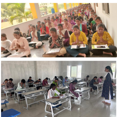
కపిల్ విద్యా వారధి నిర్వాహకులు మాట్లాడుతూ ప్రతిభావంతులైన పేద విద్యార్థులకు 'కపిల్ విద్యా వారధి' అనరా , అందుగా నిలవడానికి అర్హత పరీక్షలు నిర్వహించినట్లు తెలిపారు .

కరీంనగర్, మే 20:- పదవ తరగతి పూర్తి చేసుకుని ఆర్థిక ఇబ్బందుల వల్ల చై వరువులకు దూరమవుతున్న ప్రతిభావంతులైన విద్యార్థులను ఆదుకునేందుకు కపిల్ విద్యా వారధి ( సంక్షేమ ట్రస్ట్) ఆధ్వర్యంలో బుధవారం రోజున కరీంనగర్లోని శ్రీ సరస్వతి శివ మందిర్ లో పదో తరగతిలో 520 కి పైనే మార్కులు సాధించిన విద్యార్థులకు అర్హత పరీక్షను నిర్వహించారు. ఇట్టి అర్హత పరీక్షలకు గాను 19 జిల్లాల నుండి 917 మంది అమ్మె చేసుకోగా వీరిలో 596 మంది విద్యార్థులు పరీక్షకు హాజరయ్యారు.. ఈ సందర్భంగా కపిల్ విద్యా వారధి నిర్వాహకులు మాట్లాడుతూ ప్రతిభావంతులైన పేద విద్యార్థులకు 'కపిల్ విద్యా వారధి' అనరా , అందుగా నిలవడానికి అర్హత పరీక్షలు నిర్వహించినట్లు తెలిపారు . అర్హత పరీక్షల్లో విజయం సాధించిన విద్యార్థుల చై వరువుల కోసం , జీవితంలో నిలదడుకునే వరకు కపిల్ విద్యా వారధి సహాయ సహకారాలు అందిస్తుందిని తెలిపారు.