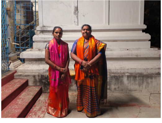
మాట్లాడుతూ... కోలాటం మన సంస్కృతి ఆదర్శులకు చిన్నప్పటి నుండి నేర్పిస్తే సాంప్రదాయాలు నిలుస్తాయి. ఈ కార్యక్రమంలో అధ్యక్షురాలు ఆలయ కమిటీ పెద్దలు మహిళా సంఘం నాయకురాలు హాజరై నూతన కార్యవర్గాన్ని శాలువాతో సన్మానించారు. భక్తులకు తీర్థ ప్రసాదాలు వితరణతో కార్యక్రమం ముగిసింది.