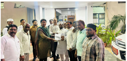
కరీంనగర్, మే 20:-నగరంలోని 59 వ డివిజన్ ముకరంపురలో మంగళవారం వీధి కుక్కల వాడిలో తీవ్ర గాయాలైన చిన్నారి కుటుంబాన్ని ఆదుకోవాలని, ప్రభుత్వవరంగా చిన్నారికి వైద్య సదుపాయాలను అందించాలని ఎంఐఎం

వీధి కుక్కలను పెళ్లర్ జోన్ కు తరలించండి.. వాటికి టీకాలు వేయించండి పాఠశాలలు, ఆసుపత్రుల వద్ద నుంచి శునకాలను తరలించండి ప్రభుత్వ ఆసుపత్రిలో ఈ అండ్ రిజన్ ఇంజక్షన్లు అందుబాటులో ఉంచే విధంగా చర్యలు తీసుకోండి జిల్లా కలెక్టర్ కు వివరాలపత్రం అందజేసిన ఎంఐఎం నాయకులు