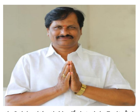
యూనియన్ల అధ్యక్ష కార్యదర్శులతో మాట్లాడుతూ మొదట మీరు ప్రభుత్వంలో విలీనం కావాలా? యూనియన్ ఎన్నికలు కావాలా?

అనేదానిపై రాతపూర్వకంగా మీ ఎంపి, కి రాసి ఇవ్వండి మీరు ఏది చేయమంటే అది చేయడానికి ప్రభుత్వం సిద్ధంగా ఉందని హామీ ఇచ్చారు. టీజీఎన్ఆర్టిసీలోని అన్ని యూనియన్లు వ్రాతపూర్వకంగా మొదట ఆర్టిసీ ఉద్యోగులను ప్రభుత్వంలో విలీనం చేయాలని కోరడం జరిగింది కానీ ఇప్పటివరకు ప్రభుత్వంలో విలీనం చేయకపోవడంతో ఆర్టిసీ ఉద్యోగులందరూ విలియం కోసం ఎదురు చూస్తున్నారు. ఇట్టి విషయంపై ముఖ్యమంత్రి ఉప ముఖ్య మంత్రిలు రవాణా శాఖ మంత్రి ప్రత్యేక చొరవ తీసుకొని వెంటనే ప్రభుత్వంలో విలీనం చేయాలని హనుమంతు ముదిరాజ్, ప్రభుత్వాన్ని కోరారు. అదేవిధంగా ఏపీఎన్ఆర్టిసీలో విలీన కమిటీలో యూనియన్లు లేకపోవడంతో అక్కడ కొన్ని ఇబ్బందులు ఏర్పడ్డాయి. ఆ ఇబ్బందులు కలగవద్దా అంటే ముందుగానే యూనియన్ల ప్రతినిధులతో కమిటీ వేస్తే అన్ని విధాల బాగుంటుందని హనుమంతు ముదిరాజు ప్రభుత్వాన్ని కోరారు.