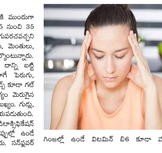
గింజల్లో ఉండే విటమిన్ బి6 కూడా హార్మోన్ల సమతుల్యతకు

అంటారని నిపుణులు వివరిస్తున్నారు. పైబర్ సమృద్ధిగా అవసరం.. ఈ పరిస్థితిని సరిచేయడానికి ముందుగా గట్ హెల్త్ పై దృష్టి పెట్టాలని సూచిస్తున్నారు. రోజుకు 25 నుంచి 35 గ్రాముల పైబర్ తీసుకోవడం ద్వారా జీర్ణవ్యవస్థను మెరుగుపరచవచ్చని చెబుతున్నారు. ఇందుకు అరటి పండ్లు, ముసగ ఆకులు, మొంతులు, అవినె గింజలు వంటి ఆహారాలు ఉపయోగపడతాయని పేర్కొంటున్నారు. అయితే శరీరం ఎంతవరకు ఫైబర్ ను తట్టుకోగలదో దాన్ని బట్టి మోతాదును నిర్ణయించుకోవాలని సూచిస్తున్నారు. అలాగే పెరుగు, కాంజీ, ఇంట్లో తయారుచేసిన పచ్చళ్ళ వంటి ఫెర్మెంటెడ్ ఫుడ్స్ కూడా గట్ ఆరోగ్యానికి మేలు చేస్తాయని చెబుతున్నారు. గట్ ఆరోగ్యం మెరుగైన తర్వాత లివర్ కు అవసరమైన పోషకాలను అందించడం ముఖ్యం. గుడ్లు, షిటాత ముఖ్యమోలీ ఉండే కాలిన్ లివర్ పనితీరుకు సహాయపడుతుంది. ఉల్లిపాయ, వెల్లుల్లిలో ఉండే సల్ఫర్ సమ్మేళనాలు డిటాక్సిఫికేషన్ ప్రక్రియకు మద్దతిస్తాయి. ఆకుకూరలు, ఉడికించిన పచ్చళ్లలో ఉండే సహజ ఫోలేట్ కూడా ఉపయోగకరమని పేర్కొంటున్నారు. సన్ ఫ్లవర్