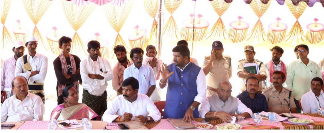
చేపట్టుమని చెప్పారు. రైతుల వాదనలు విన్న ఎస్సీ, ఎస్టీ కమిషన్ సభ్యులు పోడు రైతులకు ఎలాంటి సస్పెండ్ కలగకుండా చర్యలు తీసుకుంటామని హామీ ఇచ్చారు. పూర్తి నివేదిక సమర్పించే వరకు క్రెంట్ పనులు నిలిపివేసి, ఈ విధాని రైతులు పంటలు

కొమరంభీమ్ ఆసిఫాబాద్ : మే 19, కొమరంభీమ్ ఆసిఫాబాద్ జిల్లా కవ్వాలి ట్రైగర్ జోన్ పరిధిలో పోడు భూముల సమస్యపై ఎస్సీ, ఎస్టీ కమిషన్ సభ్యులు విచారణ నిర్వహించారు. చింతమానేపల్లి మండలంలోని కర్లెల్లి, దింద గ్రామాలలో పాటు బెజూర్ మండలంలోని పాపన్నపేట్ గ్రామాలకు చెందిన రైతులు తమ సమస్యలను కమిషన్ దృష్టికి తీసుకెళ్లారు. తాము 40 సంవత్సరాలుగా సాగు చేస్తున్న భూములను అటవీ శాఖ ఆక్రమణ ప్రమాణాలుగా చూపుతోందని రైతులు ఆవేదన వ్యక్తం చేశారు. రెండు నుంచి మూడు ఎకరాల భూములపైనే కుటుంబాల జీవనోపాధి ఆధారపడి ఉందని తెలిపారు. 15 సంవత్సరాల క్రితం తప్పిన క్రెంట్లను మళ్లీ చేప్పడంతో పంట సాగు జరుగుతోందని ఆరోపించారు. అటవీ శాఖ అధికారులు మాత్రం ఎన్టీసీఏ మార్గదర్శకాల ప్రకారమే చర్యలు తీసుకుంటామని తెలిపారు. ఎఫ్డీఓ అవ్వడం మాట్లాడుతూ రైతుల అంగీకారంతోనే పనులు