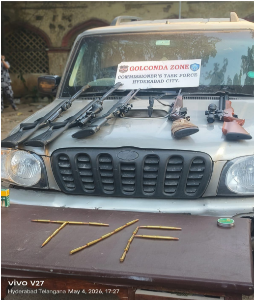
టాస్క్ఫోర్స్ సిబ్బంది ద్వారా విజయవంతంగా నిర్వహించారు.