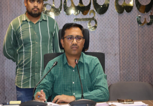
బలోపేతం చేయడం కోసం సభ్యత్వం నమోదు కార్యక్రమాన్ని నిర్వహించాలని తెలిపారు. ఖమ్మం కలెక్టరేట్లో ప్రత్యేక

జిల్లా కలెక్టర్ దివాకర్ టిఎస్ మానవ సేవే మాధవ సేవ ప్రతి ఒక్కరూ సభ్యత్వం పొందాలి డాక్టర్లు, ఉద్యోగులు, స్వచ్ఛంద సంస్థలు ముందుకు రావాలి