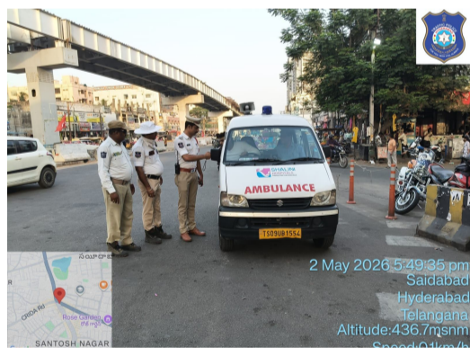
ఈ ఏడాది ఇప్పటివరకు డ్రంకెన్ డ్రైవింగ్ నిబంధనలను ఉల్లంఘించిన 27 మందిని కోర్టు ఆదేశాల మేరకు జైలుకు వంపడం జరిగిందన్నారు. మద్యం సేవించి వాహనాలు నడుపడం వల్ల మి ప్రాణాలతో పాటు ఇతరల ప్రాణాలకు కూడా ముప్పు వాటిల్లుతుందని హెచ్చరించారు.