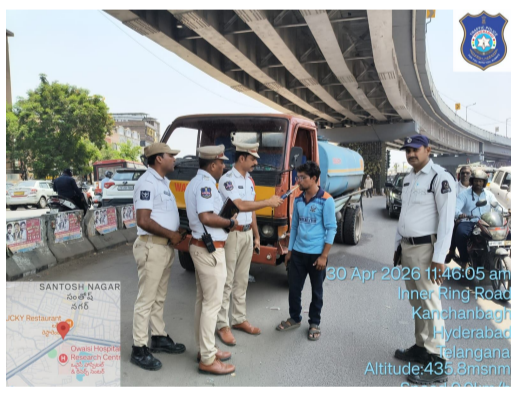
డ్రైవింగ్ తనిఖీలను ముమ్మరం చేశారు. తనిఖీల్లో మద్యం సేవించి వాహనాలు నడుపుతూ పట్టుబడిన వారిని గౌరవప్రదమైన న్యాయస్థానం ముందు హాజరుపరుస్తున్నారు. నేరం నిరూపితమైన పక్షంలో న్యాయస్థానం నిందితులకు 2 రోజుల నుండి 15 రోజుల వరకు జైలు శిక్ష విధిస్తోందన్నారు.