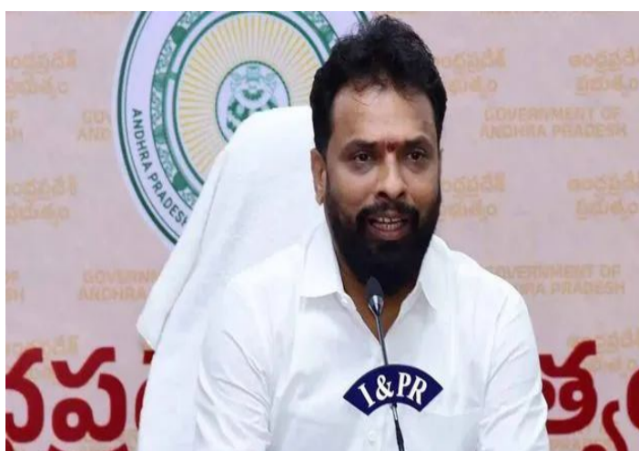
కుమార్ మే దే సందర్భంగా కార్మికులకు పాపం ఎమ్మెల్యే వర్ష కుమార్ రాజా శుభాకాంక్షలు తెలిపారు. భారతదేశ చరిత్రలో పేదల ఇంటికి వచ్చి పెన్షన్ అందిస్తున్న ఏకైక సీఎం చంద్రబాబు నాయుడు అని అన్నారు. అమ్మో ఒకటో తేదీ వస్తుందా అనే

కృష్ణా జిల్లా, మే 1: టీడీపీ జెండాలోనే కార్మికుల కోసం చక్క చివ్వాంగా ఉండని మంత్రి వాసంశెట్టి సుభాష్ అన్నారు. పమిడిముక్కల గ్రామంలో నిర్వహించిన ప్రజా వేదిక సభలో మంత్రి మాట్లాడుతూ.. గత ఐదేళ్లు వైసీపీ పాలనలో జగన్ అనేక కంపెనీలను తరమికొట్టారని విమర్శించారు. భవన నిర్మాణ కార్మికులు ఊచకోతకు గురయ్యారన్నారు. కూటమి ప్రభుత్వం వచ్చాక లక్షల కోట్ల పెట్టుబడులు రాష్ట్రానికి వస్తున్నాయని తెలిపారు. 20 లక్షల మంది భవన నిర్మాణ కార్మికులు ఉపాధి పొందుతున్నారని చెప్పారు. గత ప్రభుత్వంలో కార్మికులు తిండి లేక పస్తులు ఉన్నారని.. వారి జీవితాలను చీకటికి నెట్టారని వ్యాఖ్యానించారు. ఇప్పుడు ఏపీతో పాటు, ఇతర రాష్ట్రాల కార్మికులు రాష్ట్రంలో పనులు కోసం వస్తున్నారని మంత్రి వెల్లడించారు. ఇంటిగ్రేటెడ్ సెంటర్లుగా ఐదు నగరాలను ఎంపిక చేశామని.. వీటిని వదిలీపెట్టిన నగరాలకు విస్తరించాలని సీఎం చంద్రబాబు సూచించినట్లు తెలిపారు. కార్మికుల కోసం గుప్పెడు ఇసుక కూడా గత ప్రభుత్వం వేయలేదని మండిపడ్డారు. వారి సంక్షేమాన్ని ఏమాత్రం పట్టించుకోకుండా వారి నిధులు వాడేశారని ఆరోపించారు. కూటమి ప్రభుత్వంలో కార్మికుల కష్టాలు తీర్చి, భద్రత, భరోసా ఇచ్చామని వాసంశెట్టి సుభాష్ తెలిపారు. ఏపీ కోసం ఆలోచన చేసే ఏకైక నేత చంద్రబాబు: వర్ష