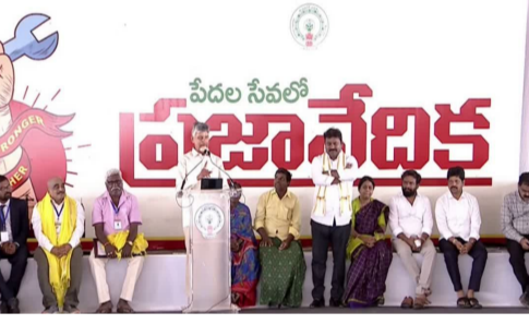
తెలిపారు. అందరూ ఆరోగ్యంగా ఉండాలనేదే మా లక్ష్యమని అన్నారు. ఆడబిడ్డలకు 33 శాతం రిజర్వేషన్లు సాధించి తీరుతామని తేల్చిచెప్పారు. చట్టసభల్లో 33 శాతం మంది మహిళలు ఉంటే నభకే శోభ వస్తుందని అన్నారు. కృష్ణా పుష్పరాల నాటికి కృష్ణా జిల్లాలో నీటి సమస్యకు శాశ్వత పరిష్కారం చూపుతామని స్పష్టం చేశారు. బందర్ పోర్టు పనులు 57 శాతం పూర్తయ్యాయని డిసెంబర్ నాటికి నిర్మాణం పూర్తి చేసి కృష్ణా జిల్లా అభివృద్ధిని నెక్స్ట్ లెవెల్లో తీసుకెళ్తామని వెల్లడించారు. భారత్ మూలా ప్రాజెక్టులో భాగంగా మచిలీపట్నం జైవీ 6 లైన్లుగా అభివృద్ధి చెందనుందని తెలిపారు. హైదరాబాద్ - మచిలీపట్నం హైవే

కృష్ణా జిల్లా: రాష్ట్రంలో ప్రయోగాత్మకంగా తొలుత కొన్ని చోట్ల లేబర్ అడ్డా నిర్మాణాలు చేపడతామని సీఎం చంద్రబాబు స్పష్టం చేశారు. బాగున్న నిర్మాణాలు ఎంపిక చేసి అదే విధంగా ప్రాంతాల్లోనూ లేబర్ అడ్డా నిర్మాణాలు ఏర్పాటు చేస్తామని వెల్లడించారు. కృష్ణా జిల్లా పమిడిముక్కలలో నిర్వహించిన 'పేదల సేవ' కార్యక్రమంలో సీఎం చంద్రబాబు పాల్గొన్నారు. అంతకుముందు కార్మికుల సంక్షేమం, నైపుణ్యం పెంపు అంశాలను తెలియజేస్తూ ఏర్పాటు చేసిన స్టాళ్లను సీఎం పరిశీలించారు. వివిధ శాఖలను నైపుణ్యం పోర్టల్తో ఇంటిగ్రేట్ చేసినట్లు సీఎంకు అధికారులు తెలిపారు. కార్మికుల సంక్షేమం, ఉపాధి కోసం నైపుణ్యం పోర్టల్తో ఇంటిగ్రేట్ చేసినట్లు వివరించారు. వీ4లో భాగంగా 35 మంది భవన నిర్మాణ కార్మికులకు సీఎం రూ.5 లక్షల ఆర్థికసాయం చేశారు. ప్రజల సంతోషాన్ని చూసి నా కష్టాన్ని మరిచిపోతున్నా: సీఎం చంద్రబాబు (జూబి) ఈ సందర్భంగా సీఎం చంద్రబాబు మాట్లాడుతూ అమరావతిలో నూతన ఈవెన్ల ఆసుపత్రి నిర్మించే యోచనలో ఉన్నట్లు చెప్పారు. అమ్మోపావురం, గుంటూరు, కర్నూలు, శ్రీసీటీ, తిరుపతి, ఈవెన్ల ఆసుపత్రిలు తీసుకొస్తామని