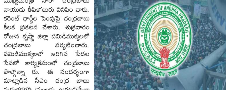
కారణంగా ప్రజలకు భారంగా మారిన ట్రాబ్ అవ్ ఛార్జీల నుంచి ట్రాబ్ చేసి ప్రజలకు విముక్తి కలిగించామని చంద్రబాబు వివరించారు. ఏపీలో విద్యుత్ రంగాన్ని గాడినపెట్టడంతో పాటుగా.. ప్రజలకు నిరంతరాయంగా నాణ్యమైన కరెంట్ అందిస్తున్నామని అన్నారు. వైసీపీ ప్రభుత్వ తీరు కారణంగా విద్యుత్ సంస్థలు నష్టాల్లో కూరుకుపోతే.. కూటమి ప్రభుత్వం అధికారంలోకి వచ్చిన తర్వాత విద్యుత్ రంగం లో సంస్కరణలు తీసుకువస్తున్నామని వివరించారు. కరెంట్ ఛార్జీల విషయంలో ప్రజలు ఎవ్వరూ కూడా ఆందోళన చెందాల్సిన పనిలే దన్ను చంద్రబాబు.. వచ్చే ఎన్నికల వరకు కరెంట్ ఛార్జీల పెంపు ఉండనని హామీ ఇచ్చారు.

అమరావతి: ఆంధ్రప్రదేశ్ ప్రజలకు ముఖ్యమంత్రి నారా చంద్రబాబు నాయుడు తీవ్రమైన వినిపించారు. కరెంట్ ఛార్జీల పెంపుపై చంద్రబాబు కీలక ప్రకటన చేశారు. శుక్రవారం రోజున కృష్ణా జిల్లా పమిడిముక్కలలో చంద్రబాబు పర్యటించారు. పమిడిముక్కలలో జరిగిన పేదల సేవలో కార్యక్రమంలో చంద్రబాబు పాల్గొన్నారు. ఈ సందర్భంగా మాట్లాడిన సీఎం చంద్ర బాబు మధ్యతరగతి ప్రజలకు ఊటనిచ్చేలా కీలక ప్రకటన చేశారు. గత ఎన్నికల సమయంలో విద్యుత్ ఛార్జీలను పెంచమని హామీ ఇచ్చామని.. వచ్చే ఎన్నికల వరకు ఒక్క పైసా కూడా ఛార్జీల పెంచమని సీఎం చంద్రబాబు నాయుడు కీలక ప్రకటన చేశారు. ఎన్నికల సమయంలో ఇచ్చిన హామీలకు కట్టుబడి ఉన్నామని.. ప్రతి హామీని నెరవేర్చేందుకు కృషి చేస్తున్నామని తెలిపారు. ప్రజలపై అదనపు భారం పడకుండా జాగ్రత్తలు తీసుకుంటున్నామని వివరించారు. ఈ క్రమంలోనే గత వైసీపీ ప్రభుత్వ తీరుపై చంద్రబాబు విమర్శలు గుప్పించారు. వైసీపీ హయాంలో ఏకంగా తొమ్మిది సార్లు కరెంట్ ఛార్జీలు పెంచి ప్రజల సర్ది విరిచారని చంద్రబాబు విమర్శించారు. వైసీపీ ప్రభుత్వం