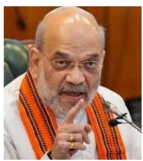
ముంబయి, మే 1: ముంబయిలో అంతర్జాతీయ డ్రగ్స్ ముఠాను నార్కోటిక్స్ కంట్రోల్ బ్యూరో ఛేదించింది. ఆ ముఠా నుంచి రూ.1,745 కోట్ల విలువైన కొక్రెన్ ను ఎన్సీబీ స్వాధీనం చేసుకుంది. కేంద్ర హోంశాఖ మంత్రి అమిత్ షా ఎక్స్ ద్వారా ఈ విషయాన్ని వెల్లడించారు. మాదకద్రవ్యాల రవాణాకు పాల్పడే ముఠాలను అణచివేయాలని నిర్ణయించుకున్నట్లు అమిత్ షా తెలిపారు. ఇందులో భాగంగా.. నార్కోటిక్స్ కంట్రోల్ బ్యూరో అంతర్జాతీయ డ్రగ్స్ ముఠాపై ఉక్కుపాదం మోపిందన్నారు. ముంబయిలో రూ.1,745 కోట్ల విలువైన 349 కిలోల కొక్రెన్ ను స్వాధీనం చేసుకున్నట్లు వెల్లడించారు. ఒక చిన్న సరకు గుర్తించి.. దానినుంచి ఒక భారీ నెట్ వర్క్ ను

పట్టుకున్నట్లు తెలిపారు. ఈ విషయానికి గాను ఎన్సీబీ బృందాన్ని ఆయన అభినందించారు. కాగా.. అందరవరల్ దాన్ దాపూద్ ఇబ్రహీం అనుచరుడు సలీమ్ డోలాను ఇటీవల తుర్కీ నుంచి భారత్ కు తీసుకొచ్చిన సంగతి తెలిసింది. ఈ నేపథ్యంలో ఇంత పెద్ద మొత్తంలో డ్రగ్స్ స్వాధీనం చేసుకోవడం