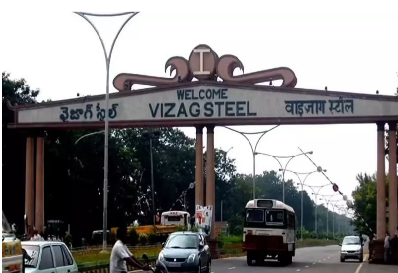
ఈ కార్యకలాపాలు ఇలాగే భవిష్యత్లో సుదీర్ఘంగా కొనసాగేందుకు అవసరమైన చేయూత ఇవ్వాలని కేంద్రం భావిస్తున్నట్లు తెలుస్తోంది. అందుకే కేంద్రం రెండోదశ ప్యాకేజీలో భాగంగా రూ.8,097 కోట్లు అందించడానికి సిద్ధమైనట్లు సమాచారం. ఏపీ ప్రభుత్వం కూడా విశాఖపట్నం స్టీల్ ప్లాంట్ విషయంలో కేంద్రంతో సంప్రదింపులు జరిపి

విశాఖపట్నం: విశాఖపట్నం స్టీల్ ప్లాంట్ కు కేంద్రం తీవ్రమైన మర్యాదలు చేస్తుంది. మరోసారి భారీగా నిధులు కేటాయించి ఆర్థిక సాయం అందించడానికి సిద్ధమైనట్లు తెలుస్తోంది. గతేడాది కేంద్రం స్టీల్ ప్లాంట్ కు రూ.11వేల కోట్ల ఆర్థిక సాయం ఇచ్చిన సంగతి తెలిసిందే. ఈ ఆర్థికసాయంతో విశాఖపట్నం స్టీల్ ప్లాంట్ మరో ట్రాక్ లో పడడంతో కార్యకలాపాలను మరింత సుస్థిరం చేసేందుకు మరోసారి రూ.8,097 కోట్లు ఆర్థికసాయం చేయడానికి కేంద్రం సిద్ధమైనట్లు సమాచారం. ఈ మేరకు కేంద్ర ఉక్కుశాఖ మంత్రి హెచ్ డి కుమారస్వామి రూ.8,097 కోట్లకు సంబంధించిన ఫైల్ ను క్షియరేషన్ ఆర్థికశాఖ ఆమోదించి కోసం పంపినట్లు తెలుస్తోంది. కేంద్ర ఆర్థికశాఖ గ్రీన్ ఫీల్డ్ ఇన్వెస్ట్ మెంట్ కేంద్ర కేబినెట్ ముందుకు వెళుతుంది.. అనంతరం ఆమోదం తెలిపి నిధులు విడుదల చేయనున్నారు. ప్రస్తుతం విశాఖపట్నం స్టీల్ ప్లాంట్ మూడు ఖర్చుపర్చేసి ప్రారంభంలో కార్యకలాపాలు ఇబ్బంది లేకుండా కొనసాగుతున్నాయి. స్టీల్ ఉత్పత్తిలో పాటు అమ్మకాలు కూడా పెరిగాయని చెబుతున్నారు.