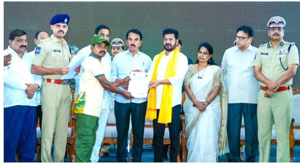
ముఖ్యమంత్రి సూచించారు. శిక్షణ కాలంలో వారికి స్పాల్ డివైజ్ అందించాలన్నారు. సమాజంలో ప్రధాన ప్రామాణ్యంలోకి గిరిజన యువతను తీసుకువచ్చే దిశగా ప్రభుత్వం తీసుకున్న ఈ నిర్ణయం

గతంలో తీవ్రవాద ప్రభావం ఉన్న ప్రాంతాల్లో అభివృద్ధిని వేగవంతం చేయడమే కాకుండా గిరిజన యువతను సమాజంలో భాగస్వామ్యం చేయాలనే లక్ష్యంతో ఈ కార్యక్రమాన్ని చేపట్టినట్లు ప్రభుత్వం తెలిపింది. ఒక్కొక్క మహిళా యువకులకు దారి చూపిన యువకులు ఇకపై పర్యాటకులకు మార్గదర్శకులుగా మారడం ప్రత్యేకంగా నిలుస్తోంది. ఈ సందర్భంగా గిరిజనకులకు యంగ్ ఇండియా స్కిల్స్ యూనివర్సిటీలో ఆరు నెలల పాటు సాఫ్ట్ స్కిల్స్ శిక్షణ ఇవ్వాలని