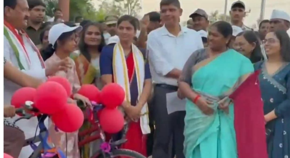
మంత్రి సీతక్క స్వయంగా మహిళలతో కలిసి అక్షరాల దిద్దించి, కార్యక్రమాలు మహిళలు, బాలికల భవిష్యత్తును మరింత వారిలో ఉత్సాహాన్ని నింపారు. ప్రభుత్వం చేపడుతున్న ఈ బలోపేతం చేస్తాయని ఆమె పేర్కొన్నారు.

టీనేజ్ బాలికల సాధికారత కోసం రాష్ట్ర ప్రభుత్వం చేపట్టిన 'స్నేహ సమర్థి' ప్రోగ్రాంలో భాగంగా సైకిల్ రైడింగ్ శిక్షణ కార్యక్రమాన్ని మంత్రి సీతక్క ప్రారంభించారు. గ్రామీణ ప్రాంతాల బాలికలకు అభివృద్ధి కోసం పెంపొందించడమే లక్ష్యంగా ఈ కార్యక్రమాన్ని నిర్వహిస్తున్నట్లు తెలిపారు. ఈ సందర్భంగా మంత్రి మాట్లాడుతూ భవిష్యత్తులో బాలికలు స్వతంత్రంగా ప్రయాణించేందుకు, బైక్ రైడింగ్ నేర్చుకునేందుకు ఇది తొలి అడుగుగా ఉపయోగపడుతుందని అన్నారు. సెన్స్ అభ్యర్థులలో నిర్వహిస్తున్న ఈ సమర్థి ట్రైనింగ్ ప్రోగ్రాంలో భాగంగా లైఫ్ స్కిల్స్, ప్రాక్టీకల్ నైపుణ్యాలను బాలికలకు బోధిస్తున్నట్లు పేర్కొన్నారు. సైకిల్ రైడింగ్ శిక్షణతో పాటు బాలిక్లో డ్రైర్లం, అత్యున్నతం పెంపొందించడంపై ప్రత్యేక దృష్టి సారించామని తెలిపారు. గ్రామ గ్రామాన ఈ తరహా శిక్షణ కార్యక్రమాలను విస్తరించాలని అధికారులకు సూచించారు. ఇదే కార్యక్రమంలో భాగంగా 'అమృత అక్షరమాల' కార్యక్రమాన్ని కూడా మంత్రి ప్రారంభించారు. ఈ వధకం ద్వారా మహిళలకు అక్షరాస్యత కల్పిస్తూ చదవడం, రాయడం నేర్పిస్తున్నామని తెలిపారు. రాష్ట్రవ్యాప్తంగా సుమారు 12 లక్షల మహిళలకు విద్యాభ్యాసం అందిస్తున్నట్లు వెల్లడించారు. మహిళల సాధికారతకు విద్య అత్యంత కీలకమని మంత్రి పేర్కొన్నారు. ప్రతి మహిళ అక్షరాస్యురాలిగా మారితే కుటుంబం, సమాజం అభివృద్ధి సాధ్యమవుతుందని అన్నారు. ఈ కార్యక్రమంలో