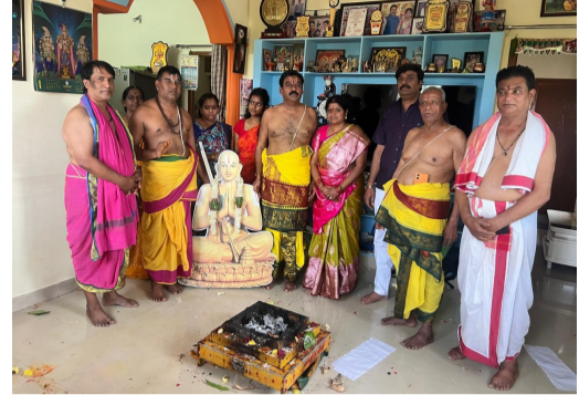
మాట్లాడుతూ సమాజానికి సమానత్వ సందేశాన్ని అందించిన మహనీయుడు శ్రీ భగవత్ రామానుజా చార్యులని కొనియాడారు. సర్వ జనులకు ఆలయ ప్రవేశం కల్పించడంలో ఆయన చూపిన దూరదృష్టి అపారమని తెలిపారు. అంతేకాకుండా అష్టాక్షరి మహా మంత్రాన్ని ఆలయ గోపురం ఎక్కి భక్తులకు బహిరంగంగా అందించి భక్తి మార్గాన్ని అందరికీ చేరువ చేసిన మహోన్నత దార్శనికుడని వివరించారు. విశిష్టవైభవ సిద్ధాంతాన్ని ప్రపంచానికి పరిచయం చేసి, దివ్య ప్రబంధాల ద్వారా భక్తి మార్గాన్ని బలపరిచిన శ్రీ రామానుజాచార్యులు సర్వ మానవాళిని సన్మాన్యంలో నడిపించిన గొప్ప ఆచార్యులని పేర్కొన్నారు. ఈ కార్యక్రమంలో భక్తి భావాన్ని పెంపొందించడంతో పాటు, రామానుజాచార్యుల మహోన్నత సేవలను స్ఫూరించుకునే వేదికగా నిలిచింది.