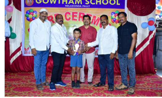
చేతుల మీదుగా షీల్డులు, మెడల్స్, మెరిట్ నర్టిఫికేట్లు అందజేశారు. ఈ కార్యక్రమానికి ముఖ్య అతిథులుగా జిల్లా

ఖమ్మం /నేలకొండపల్లి/ఏప్రిల్ 07/(పీపుల్స్ న్యూస్ ) :2025-26 విద్యా సంవత్సరానికి గాను ప్రతిభ కనబరిచిన విద్యార్థులకు ఖమ్మం జిల్లా, నేలకొండపల్లిలోని గౌతమ్ పాఠశాలలో వార్షిక పురస్కారాలను అత్యంత వైభవంగా ప్రధానం చేశారు. వివిధ విద్యా విభాగాల్లో మరియు సజ్జతల్లో అత్యుత్తమ ప్రదర్శన కనబరిచిన విద్యార్థులను ఈ సందర్భంగా ఘనంగా సత్కరించారు. పాఠశాల స్టాయి క్లాస్ టాపర్స్ తో పాటు ఐబిడి, కంప్యూటర్స్, మ్యాథ్స్, ఇంగ్లీష్, లిటింగ్ వంటి విభాగాల్లో ప్రథమ, ద్వితీయ స్థానాలు సాధించిన విజేతలకు అతిథుల