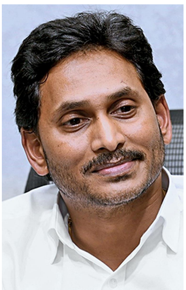
జగన్ తనవికృత రాజకీయ మేధాను ప్రదర్శించి మరొకరు సాటిరారని ప్రచారం చేసుకున్నారు. ఇలాంటి రాజకీయ నేతల వల్ల ప్రజలకు కానీ, రాష్ట్రానికీ కానీ మేలు జరగదు. ఘక్తు పూడలే వ్యవస్థకు పునాదిగా జగన్ రాజకీయ ఆలోచనలు అర్థం పడుతున్నాయి.