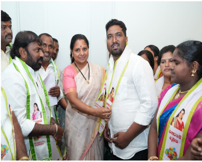
జిల్లాలో జాగృతిని బలోపేతం చేయడంలో జిల్లా నాయకత్వం

తెలంగాణ జాగృతి రాజకీయ శక్తిగా అవతరించుకునే పథ్యంలో సన్నాహక సమావేశాలు వేగం వుంజుకున్నాయి. జాగృతి అధ్యక్షురాలు కల్పకుంట్ల కవిత అధ్యక్షతన హైదరాబాద్ కేంద్ర కార్యాలయంలో ఉమ్మడి కరీంనగర్ జిల్లా నాయకులతో గురువారం సమావేశం నిర్వహించారు. ఈ సందర్భంగా కవిత మాట్లాడుతూ ఈ నెల 25న జరగనున్న జాగృతి ఆవిర్భావ సభను విజయవంతం చేయాలని పిలుపునిచ్చారు. కరీంనగర్ జిల్లా నుంచి పెద్దఎత్తున నాయకులు, కార్యకర్తలు హాజరై సభను ఘనంగా నిర్వహించాలని కోరారు. జాగృతి రాష్ట్ర భవిష్యత్తును మార్చే రాజకీయ శక్తిగా ఎదుగుతుందని ఆమె విశ్వాసం వ్యక్తం చేశారు. గత రెండు దశాబ్దాలుగా జాగృతి ప్రజా సమస్యల పరిష్కారం, తెలంగాణ సంస్కృతి, సంప్రదాయాల పరిరక్షణలో కీలక పాత్ర పోషించిందని తెలిపారు. రానున్న రోజుల్లో కూడా ప్రతి కార్యకర్త ప్రజల సమస్యలపై స్పందించి, అవసరమైతే పోరాడి పరిష్కారం సాధించాలని సూచించారు. కరీంనగర్