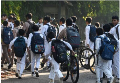
అంతరాయం లేకుండా వారానికి ఒకసారి అడనవు తరగతులు నిర్వహించవచ్చని తెలిపింది.

ప్రకటించారు. విద్యాశాఖ తాజా ప్రకటన ప్రకారం.. తెలంగాణలోని స్కూళ్లకు ఈ ఏడాది ఏకంగా 48 రోజుల పాటు వేసవి సెలవులు ఉండనున్నాయి. ఏప్రిల్ 24వ తేదీ నుంచి జూన్ 11వ తేదీ వరకు ఈ సెలవులు అమల్లో ఉంటాయి. రాష్ట్రంలోని అన్ని ప్రభుత్వ, ప్రైవేటు, ఎయిడెడ్ పాఠశాలలకు ఈ నిబంధన వర్తిస్తుందని ప్రభుత్వం స్పష్టం చేసింది. సుదీర్ఘ వేసవి సెలవుల అనంతరం జూన్ 12వ తిరిగి పాఠశాలలు పునఃప్రారంభం కానున్నాయి. సెలవులు ప్రారంభమయ్యే లోపు నిలబన్ పూర్తి అయ్యేలా చూడాలని ప్రభుత్వం పాఠశాలల యాజమాన్యాలకు సూచించింది. అవసరమైతే విద్యావరంగా ఎలాంటి