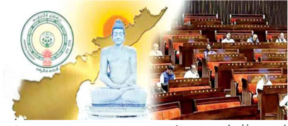
చర్చకు అనుమతి ఇచ్చారు. అమరావతి చట్టబద్ధత బిల్లుపై జరిగిన చర్చలో 11 పార్టీలు నుంచి 18 మంది సభ్యులు పాల్గొన్నారు. అయితే వైసీపీ రాజ్యసభలో కూడా బిల్లును వ్యతిరేకించి వాకాట్ చేసింది.

న్యూఢిల్లీ, ఏప్రిల్ 02 : ఆంధ్రప్రదేశ్ రాజధాని అమరావతికి చట్టబద్ధత కల్పించే బిల్లుకు రాజ్యసభ ఆమోదం తెలిపింది. దీంతో ఈ బిల్లుకు పార్లమెంట్ ఉభయ సభల ఆమోదముద్ర ప్రక్రియ ముగిసింది. ఈ బిల్లును కేంద్రం రాష్ట్రపతికి పంపిస్తుంది. ఈ బిల్లుపై రాష్ట్రపతి ద్రౌపది ముర్ము నం తకం చేసిన తరువాత గెజిట్ నోటిఫికేషన్ విడుదల కానుంది. గురువారం రాజ్యసభలో కేంద్ర హోం శాఖ సహాయ మంత్రి నిత్యానంద రారు బిల్లును ప్రవేశపెట్టినారు. రాజ్యసభ చైర్మన్ సీపీ రాధాకృష్ణన్ బిల్లుపై