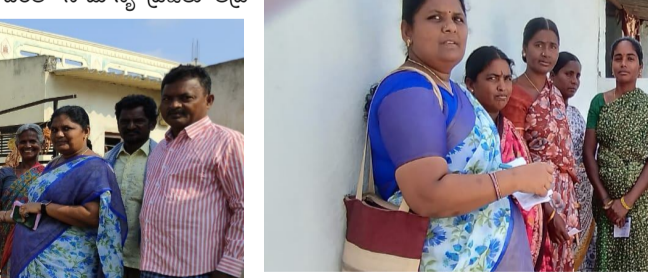
ఇబ్బందులు ఎదుర్కొంటున్నారని వ్యక్తం

అమాంతం పెరిగిపోయాడని, దీంతో సామాన్య ప్రజలు తీవ్ర