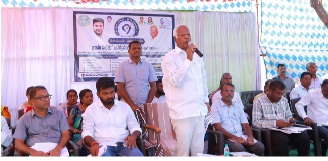
ఇళ్లను మంజూరు చేయగా, రెండో విడతలో మరో 30 ఇళ్లను