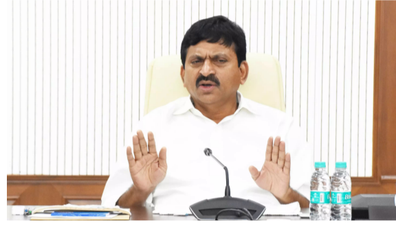
హైదరాబాద్, ఏప్రిల్ 1 : తెలంగాణలో భూ వివాదాలకు ప్రభుత్వం చెక్ పెట్టనుంది. ఏప్రిల్ 2 నుంచి రాష్ట్ర వ్యాప్తంగా భూభారతి సేవలు అమలు చేయనుంది. ప్రయోగాత్మకంగా 5

● ఐదు మండలాల్లో ప్రయోగాత్మకం ● అధికారులతో సమాజ్ఞించిన మంత్రి పాంగులేటి