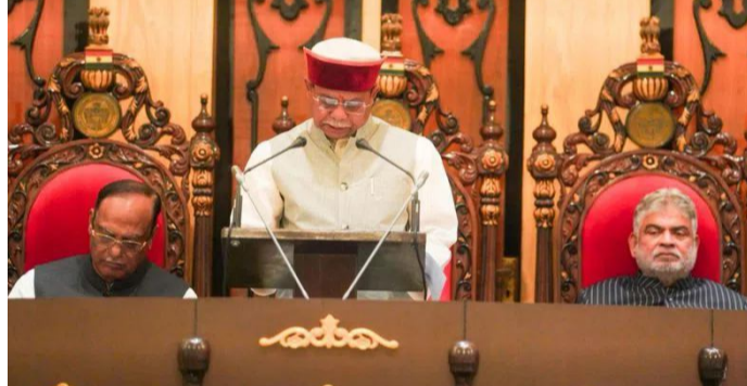
హైదరాబాద్, మార్చి 16 : ప్రతిపౌరుడు అభివృద్ధిలో భాగస్వామిగా ఉండేలా బడ్జెట్ను రూపొందించినట్లు తెలంగాణ గవర్నర్ శివప్రతాప్ శుక్లా తెలిపారు. ప్రజా సంక్షేమమే లక్ష్యంగా పాలన సాగుతోందన్నారు. 2047 తెలంగాణ రైజింగ్ దిశగా

● ఆమెరకు తెలంగాణ బడ్జెట్ రూపకల్పన ● 2047 తెలంగాణ రైజింగ్ దిశగా అడుగులు ● 3 క్రిటియన్ దాలర్ ఆర్థిక వ్యవస్థ లక్ష్యం ● దేశ జీడీపీకి తెలంగాణ 4.99 శాతం అందిస్తోంది ● ఈజీ అఫ్ డూయింగ్ జిజనెస్ ద్వారా రాష్ట్ర అభివృద్ధి ● గోబల్ సమిటి ద్వారా 5 లక్షల 72 వేల కోట్ల పెట్టుబడులు ● పొల్డ్ పాలసీ ద్వారా పరిశ్రమల భూముల బదలాయింపు ● రాష్ట్రంలోని ఏదలందరికీ ఇందిరమ్మ ఇళ్ల నిర్మాణం ● మూసీనది ప్రక్షాళనకు పథకాల రచన చేపట్టాం ● బిటి ఎగుమతులు రూ.3.13 లక్షల కోట్లకు చేరిక ● తెలంగాణ అసెంబ్లీ ● సమావేశాల తొలిరోజు గవర్నర్ ప్రసంగం తొలుత తెలుగులో ప్రసంగం ప్రారంభించిన గవర్నర్ శుక్లా