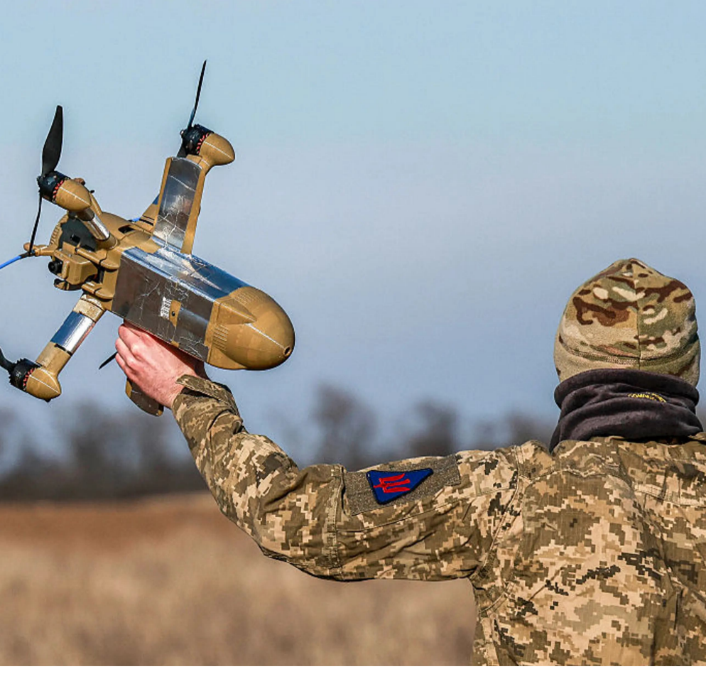
వద్ద భద్రత పెంచినట్లు అధికారులు పేర్కొన్నారు.

బెహ్రేన్, ఫిబ్రవరి 16: ఇరాన్ తో ఇజ్రాయెల్, అమెరికా యుద్ధంతో పశ్చిమాసియాలో ఉద్రిక్తతలు కొనసాగుతున్నాయి. ఇజ్రాయెల్, అమెరికా దాడులకు ప్రతీకారంగా ఇరాన్.. డ్రోన్ దాడులను తీవ్రతరం చేసింది. తన పొరుగుదేశాల్లోని అమెరికా స్థావరాలే లక్ష్యంగా డ్రోన్లతో విరుచుకుపడుతోంది. సోమవారం తెల్లవారుజామున దుబాయ్ అంతర్జాతీయ విమానాశ్రయం సమీపంలో డ్రోన్ దాడులు చేసింది. ఈ సందర్భంగా ఒక డ్రోన్ ఇంధన ట్యాంక్ను ఢీకొట్టడంతో భారీగా మంటలు చెలరేగాయి. దాంతో విమానాశ్రయంలోని అన్ని విమానాలను తాత్కాలికంగా నిలిపివేశారు. విమానాశ్రయాన్ని మూసివేసినట్లు దుబాయ్ సివిల్ ఏవియేషన్ అథారిటీ అధికారులు ప్రకటించారు. ప్రయాణికులు, ఎయిర్పోర్టు సిబ్బందికి సేఫ్టీ నోటీస్ జారీచేశారు. విమానాల స్టేటస్ తెలుసుకునేందుకు విమానయాన సంస్థలను సంప్రదించాలని ప్రయాణికులకు సూచనచేశారు. అంతేగాక పలు విమానాలను అల్ మక్కామ్ అంతర్జాతీయ విమానాశ్రయానికి మళ్లించినట్లు ఎయిర్పోర్ట్ అధికారులు తెలిపారు. ఇంధన ట్యాంక్కు అంటుకున్న మంటలను ఆర్పేందుకు దుబాయ్ సివిల్ డిఫెన్స్ సిబ్బంది తీవ్రంగా శ్రమిస్తున్నారు. సమీపంలోని ప్రజలు ఇళ్లలోనే ఉండాలని అధికారులు ఆదేశాలు జారీ చేశారు. ఇంధన ట్యాంక్పై దాడి నేపథ్యంలో ఈ ప్రాంతంలోని కీలకమైన ఇతర మౌలిక సదుపాయాల