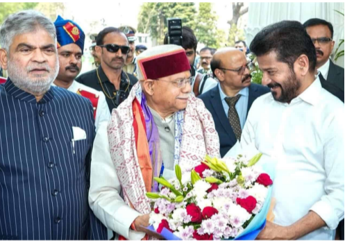
అడుగులు వేస్తున్నట్లు గవర్నర్ శివప్రతాప్ శుక్లా పేర్కొన్నారు. తెలంగాణ అసెంబ్లీ బడ్జెట్ సమావేశాలు సోమవారం ప్రారంభమయ్యాయి. అసెంబ్లీలో తొలిసారి తెలంగాణ రాష్ట్ర గీతాన్ని ఆలపించారు. ఆపై గవర్నర్ మిగతా2లో...