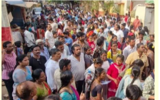
అమరావతి : ఎపిలో పదో తరగతి పరీక్షలు ప్రశాంతంగా సోమవారం ప్రారంభం అయ్యాయి. గంట ముందుగానే పరీక్ష కేంద్రాలకు మిగతా2లో...

గంట ముందుగానే కేంద్రాలకు చేరుకున్న విద్యార్థులు అర గంట ముందుగానే లోపలికి అనుమతి క్షణంగా పరిశీలించి లోపలికి అనుమతి విద్యార్థులకు శుభాకాంక్షలు తెలిపిన మంత్రి లోకేశ్