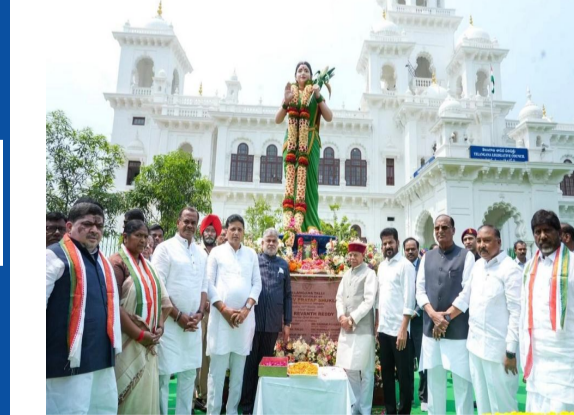
హైదరాబాద్, మార్చి 16 : శాసనసభ ప్రాంగణంలో తెలంగాణ తల్లి విగ్రహవిష్కరణ కార్యక్రమం ఘనంగా జరిగింది. పునరుద్ధరించిన మండలి భవనం ముందు తెలంగాణ తల్లి విగ్రహాన్ని రాష్ట్ర గవర్నర్ శివ ప్రతాప్ శుక్లా ఆవిష్కరించారు. సీఎం, మండలి చైర్మన్ గుత్తా సుఖేందర్ రెడ్డి, శాసనసభ స్పీకర్ గడ్డం ప్రసాద్ కుమార్ తో పాటు వలువురు మంత్రులు, ఎమ్మెల్యేలు పాల్గొన్నారు. రాష్ట్ర శాసనసభ ఆవరణలో రాష్ట్ర ఆత్మగౌరవ విస్తారంగా సూతనంగా రూపొందించిన తెలంగాణ తల్లి విగ్రహాన్ని గవర్నర్ శివ ప్రతాప్ శుక్లా వైభవంగా మిగతా2లో...

ఆవిష్కరించారు. ఈ చారిత్రక ఘట్టం రాష్ట్ర ప్రముఖులు, మంత్రుల సమక్షంలో అత్యంత వేడుకగా జరిగింది. అనంతరం విగ్రహం వద్ద పుష్పాంజలి ఘటించారు. విగ్రహ ఆవిష్కరణ కార్యక్రమానికి ముందు ఒక ప్రత్యేక కార్యక్రమం జరిగింది. అసెంబ్లీ ఆవరణలో ఉన్న జాతిపిత మహాత్మా గాంధీ, రాజ్యాంగ నిర్మాత డాక్టర్ బి.ఆర్. అంబేద్కర్ విగ్రహాల వద్ద గవర్నర్ శివ ప్రతాప్ శుక్లా, ముఖ్యమంత్రి రేపంత్ రెడ్డి, డిప్యూటీ సీఎం మల్లు భట్టి విక్రమారావు ఘనంగా నివాళులర్పించారు. దేశానికి, సమాజానికి వారు చేసిన అసమాన సేవలను నేతలు స్మరించుకున్నారు. తెలంగాణ తల్లి విగ్రహాన్ని ఆవిష్కరించిన అనంతరం ముఖ్యమంత్రి రేపంత్ రెడ్డి సభను ఒక్కడేరించి మాట్లాడారు. ఈ విగ్రహం కేవలం ఒక నిర్మాణం మాత్రమే కాదని, ఇది తెలంగాణ ప్రజల పోరాట పటిమకు, సంస్కృతికి, ఆత్మగౌరవానికి నిలువెత్తు ప్రతీక అని ఆయన అభివర్ణించారు. రాష్ట్ర అస్తిత్వాన్ని ప్రతిబింబించేలా ఈ విగ్రహాన్ని తీర్చిదిద్దినట్లు ఆయన పేర్కొన్నారు.